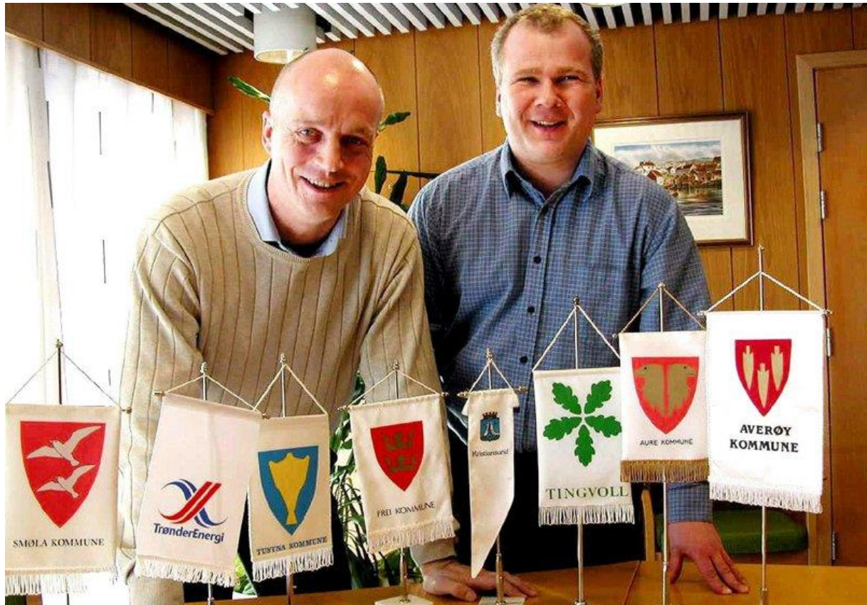
NEAS – Nordmøre Energiverk AS har gitt utbytte til sine eiere

Et AS er et eget rettssubjekt. De ansatte har selskapet som arbeidsgiver og daglig leder som øverste administrative leder. Ansvar for arbeidsgiverpolitikken for selskapet ligger til styret. Aksjeloven regulerer ansatte sin representasjon i styret. AS fører regnskap etter regnskapsloven, og utarbeider årsmelding og årsberetning i henhold til bestemmelsene i denne.