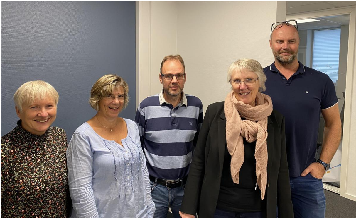
Bilde: Gericafaggruppe i IKT-ORKide

samarbeidende kommunene instruerer kommunedirektørene sine om å delegere fullmakt til kommunedirektøren i vertskommunen. Vertskommunesamarbeid med felles folkevalgt nemd innebærer at kommunene oppretter en felles nemd hos vertskommunen med minimum 2 deltakere fra hver kommune. Deltakerkommunene kan delegere til nemnda myndighet til å treffe vedtak også i saker av prinsipiell betydning. Dette skal skje ved at kommunestyrene eller fylkestingene selv delegerer samme kompetanse til nemnda. Nemnda kan delegere til vertskommunens administrasjon myndighet til å treffe vedtak i enkeltsaker eller typer av saker som ikke er av prinsipiell betydning.