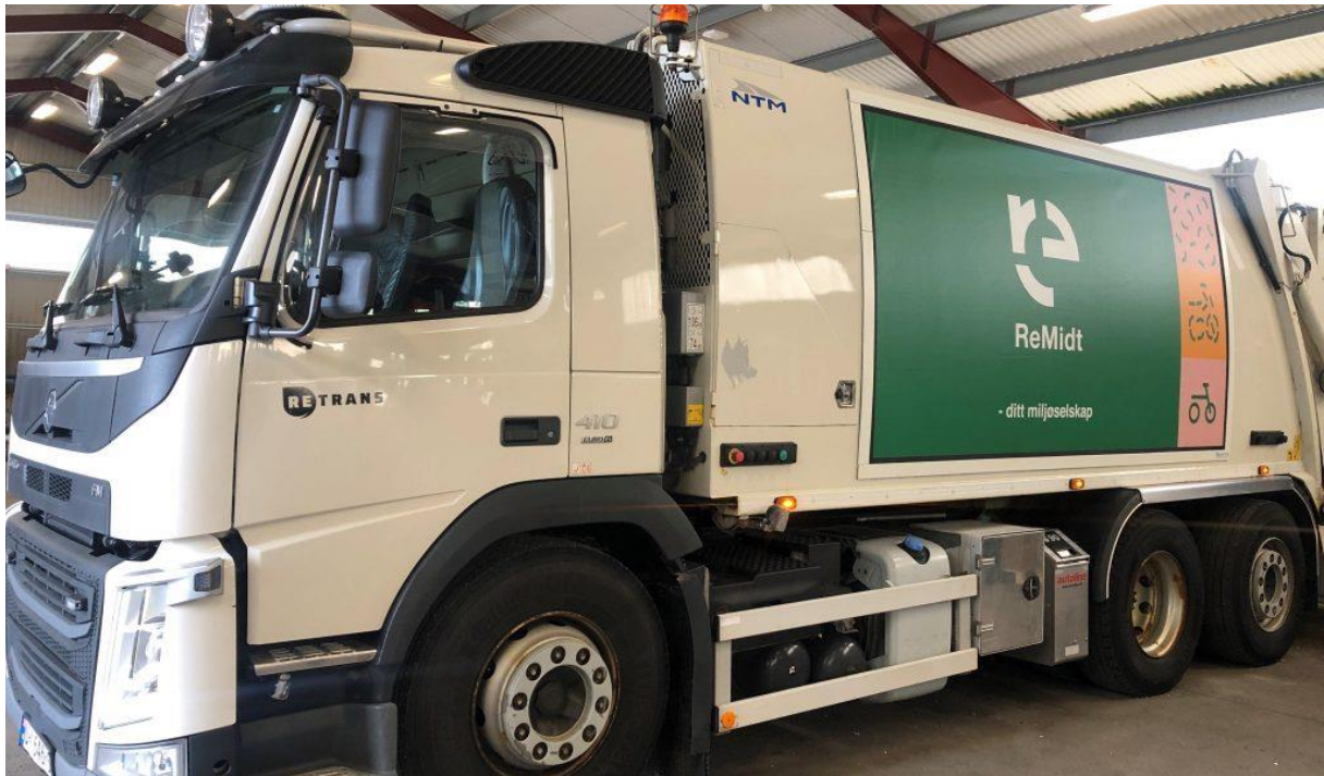
ReMidt IKS er det nye renovasjonsselskapet for Averøy kommune

representantskapet, men det er ikke krav om løpende rapportering. Et IKS må ha en selskapsavtale og denne kan sette ytterligere krav til hvilke saker som må godkjennes av representantskapet. Innenfor sitt myndighetsområde kan representantskapet instruere styret og omgjøre beslutninger. Overfor tredjepart kan denne muligheten begrenses av at et utvidet myndighetsområde for representantskapet ikke er allment kjent.